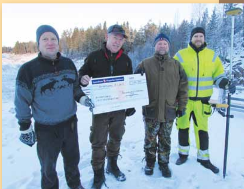
Buttentjern Jakttskytesenter, fullføring av flerbruksbane.