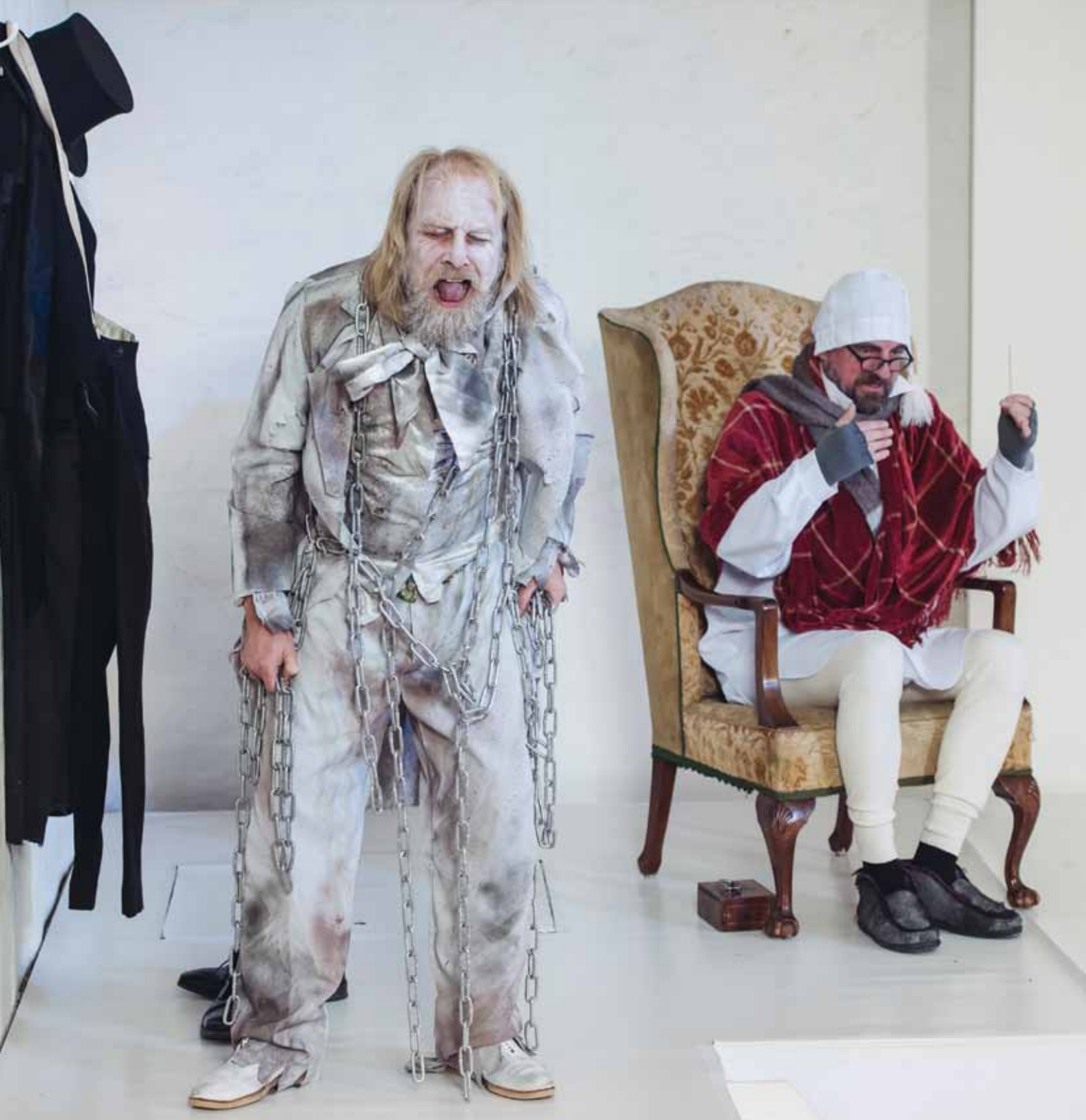
Hadeland Teaterlags oppsetting "En julefortelling" av Charles Dickens på Hadelands Glassverk.