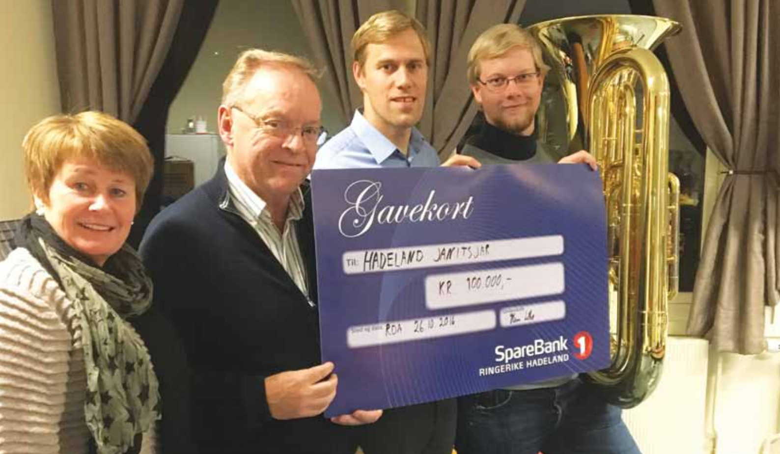
Hadeland Janitsjar.