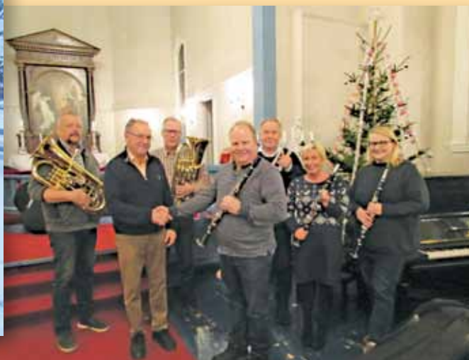
Jevnaker Ungomskorps, kjøp av instrumenter.