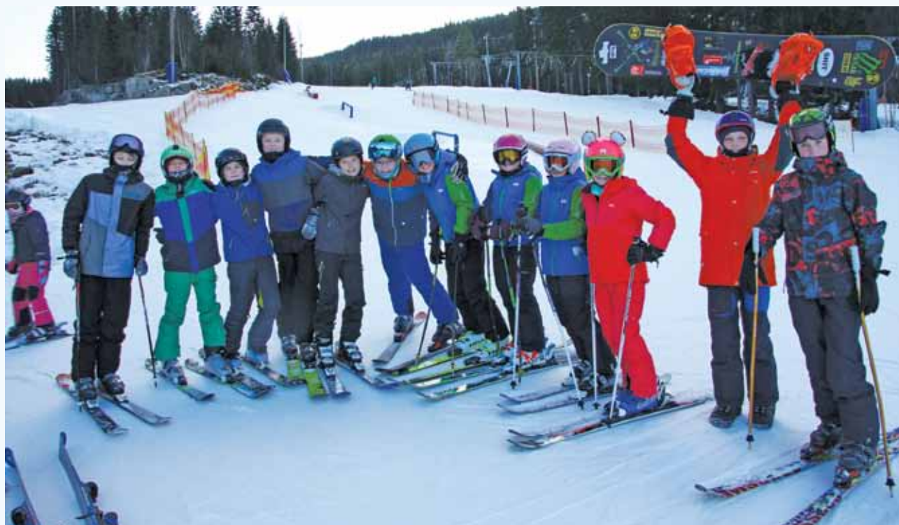
Hakadal IL: Kr 2 500 000 til kjøp av Våringskollen.