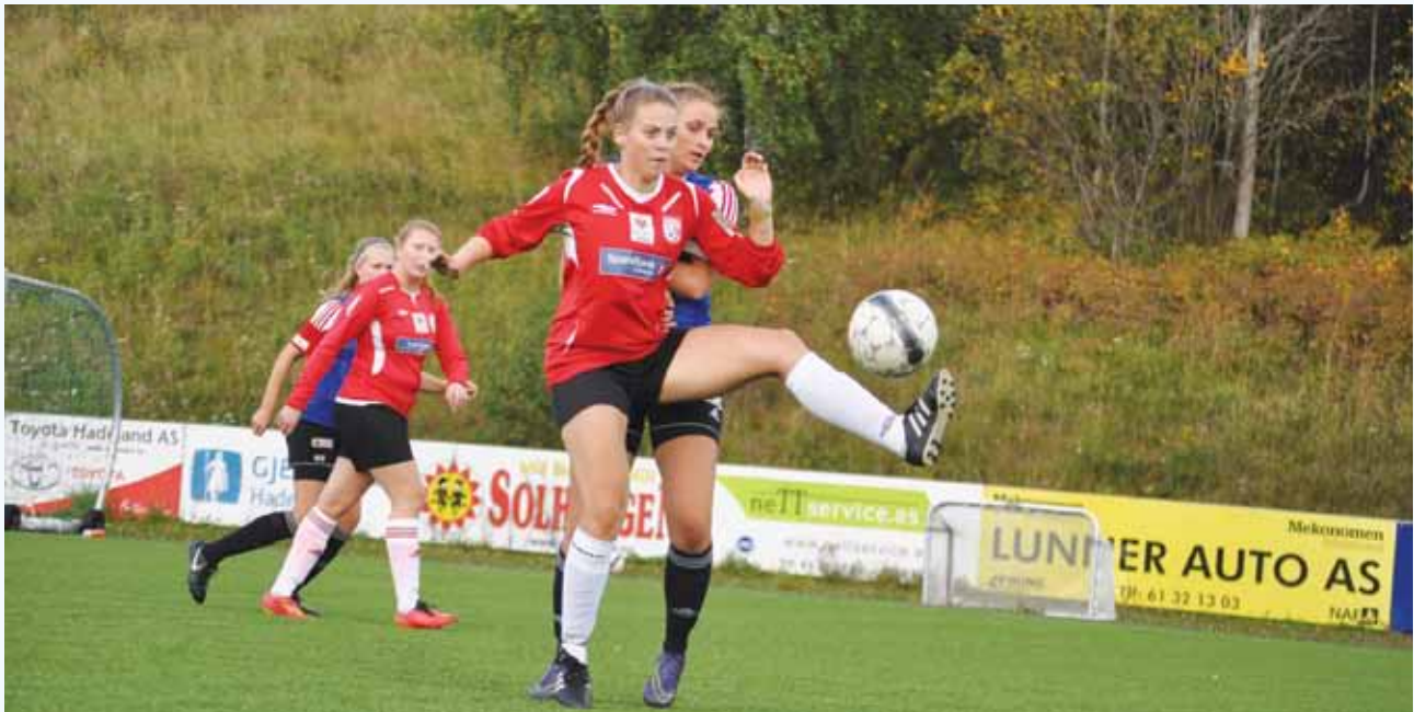
Lunner Fotballklubb: Kr 3 000 000 til nytt klubbhus og baner.