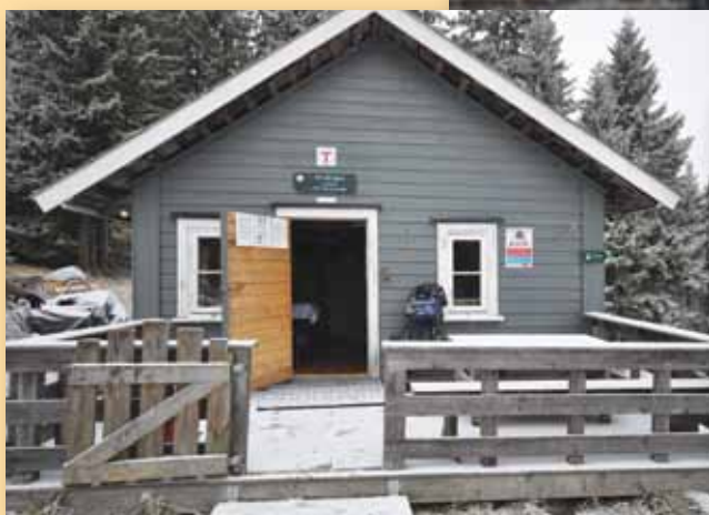
Oppussing av turisthytta Snellingen.