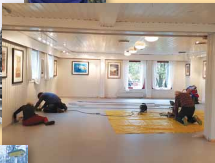
Nittedal IL, oppussing av klubbhus.