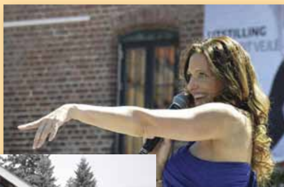
Gratis konsert ved Hadeland Glassverk.