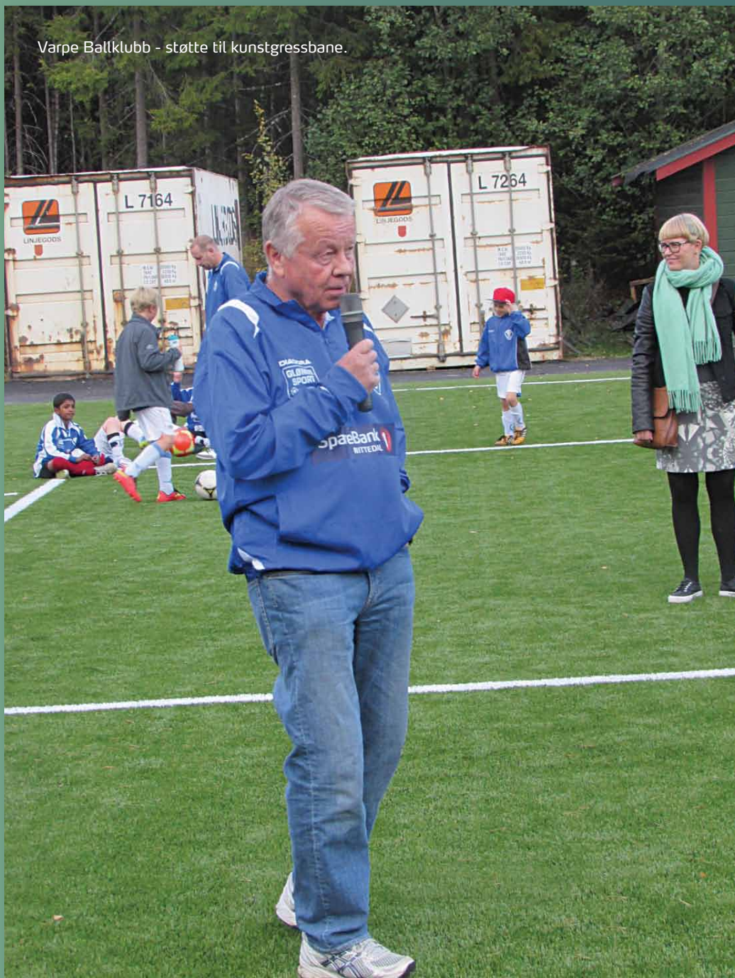
Varpe Ballklubb - støtte til kunstgressbane.