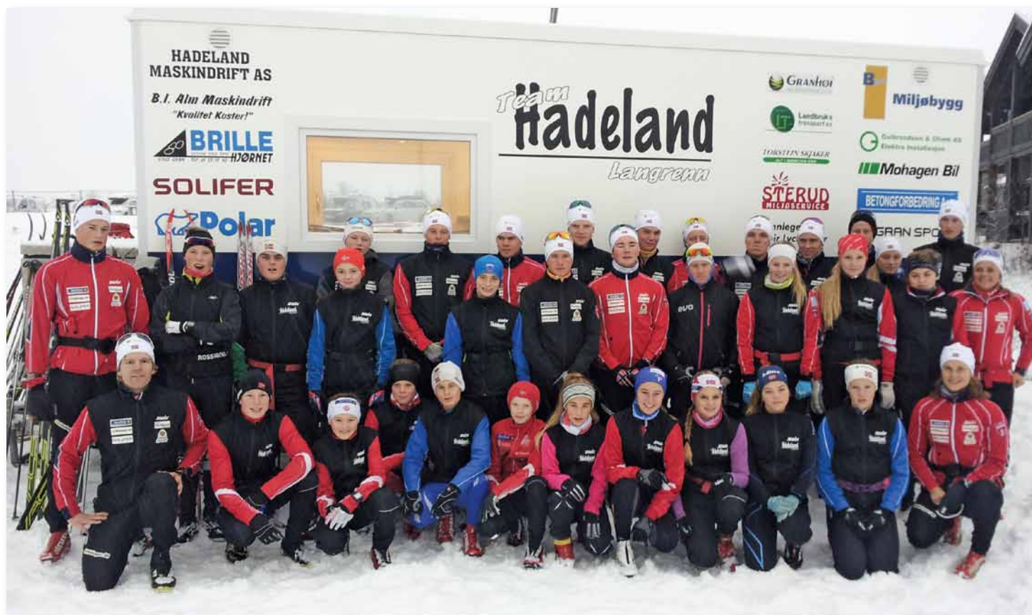
Team Hadeland Langrenn