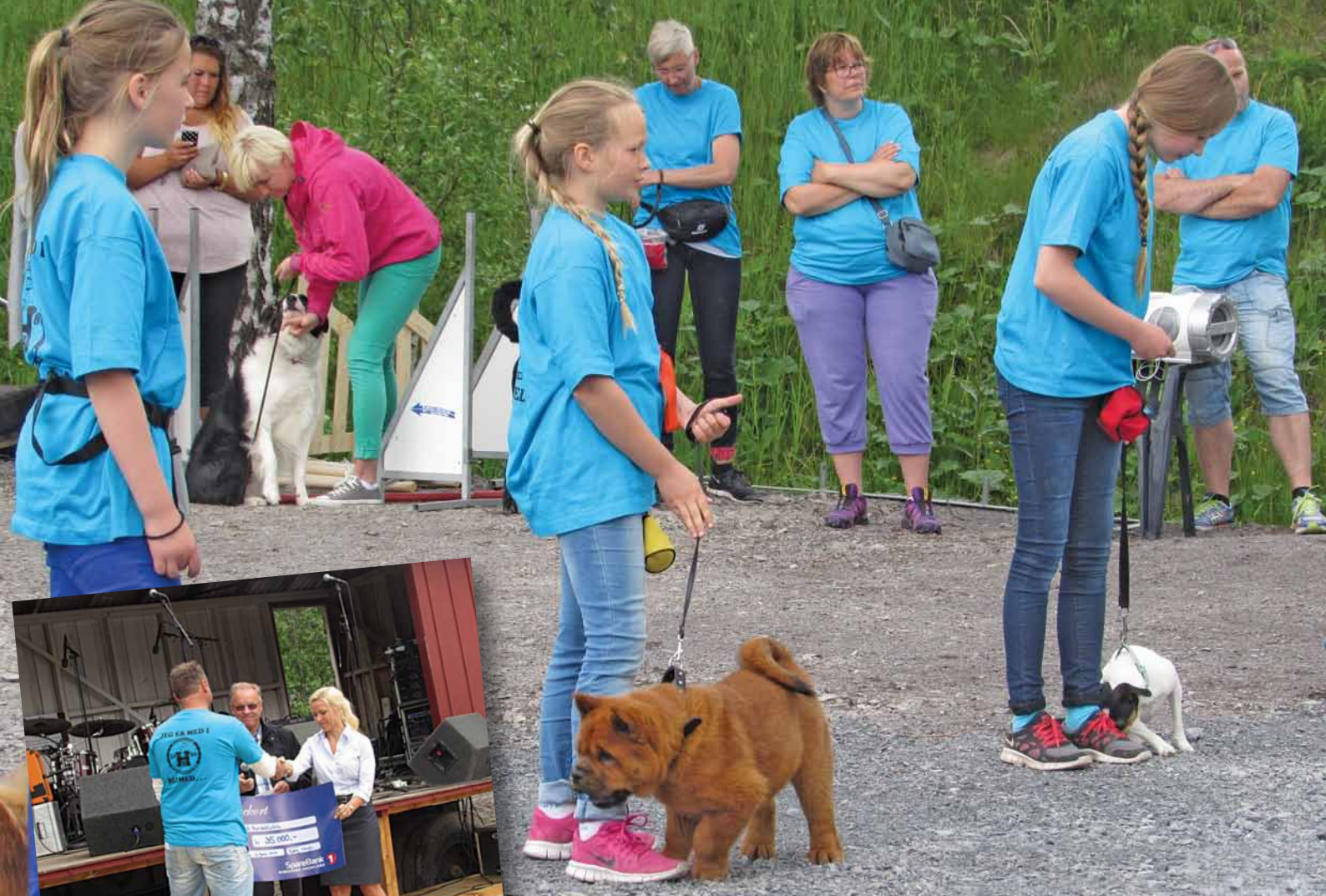
Hadeland Hundeklubb - støtte til agilitybane.