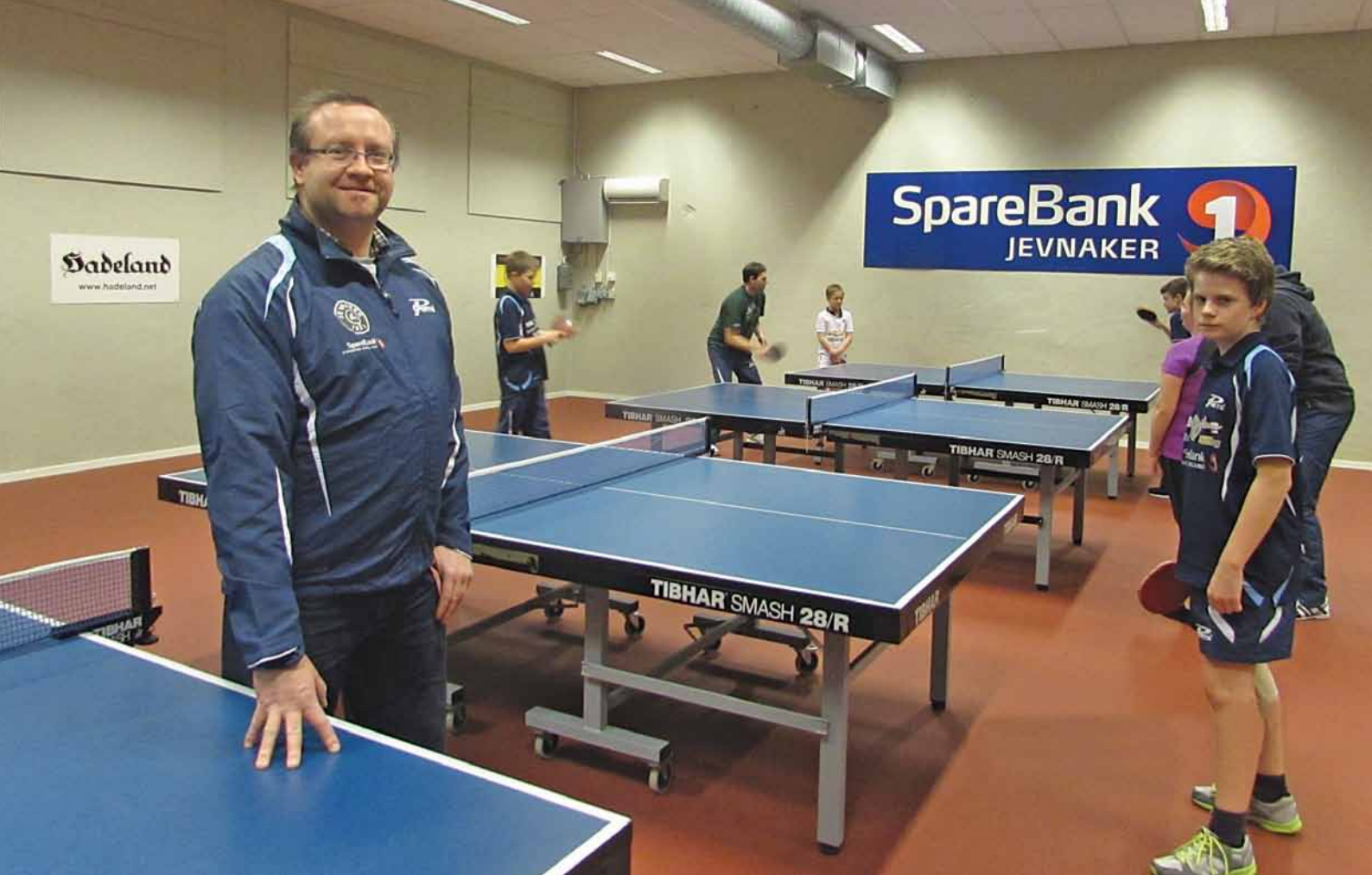
Jevnaker Bordtennisklubb. Støtte til nytt gulv i bordtennishallen.