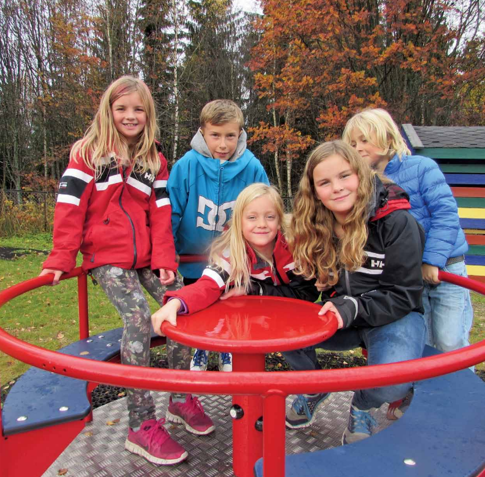
Burås Vel - støtte til lekeplass.